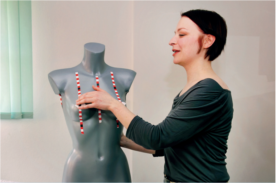
Übung an einem Kunststofftorso im Rahmen der Ausbildung zur Medizinischen Tastuntersucherin (MTU)