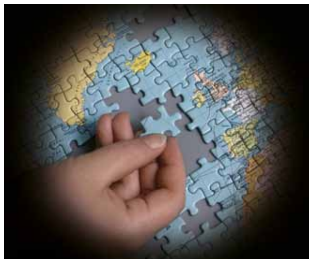
Seheindruck bei Retinopathia pigmentosa