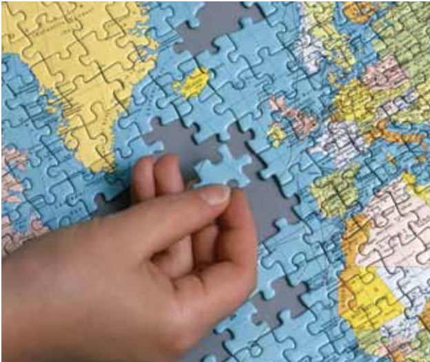
Seheindruck ohne Beeinträchtigung