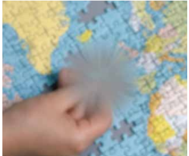
Seheindruck bei AMD