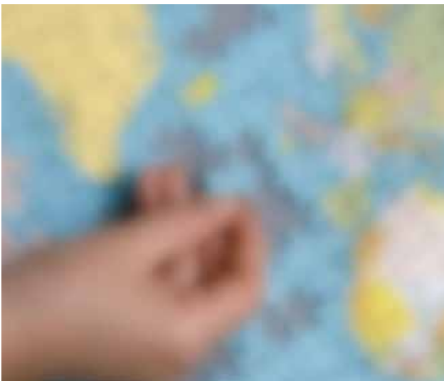
Seheindruck bei Katarakt (Grauer Star)