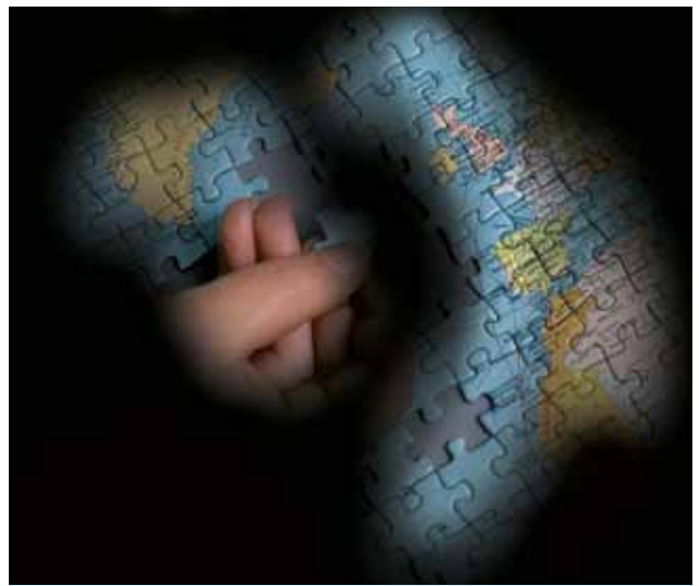
Seheindruck bei Glaukom (Grüner Star)