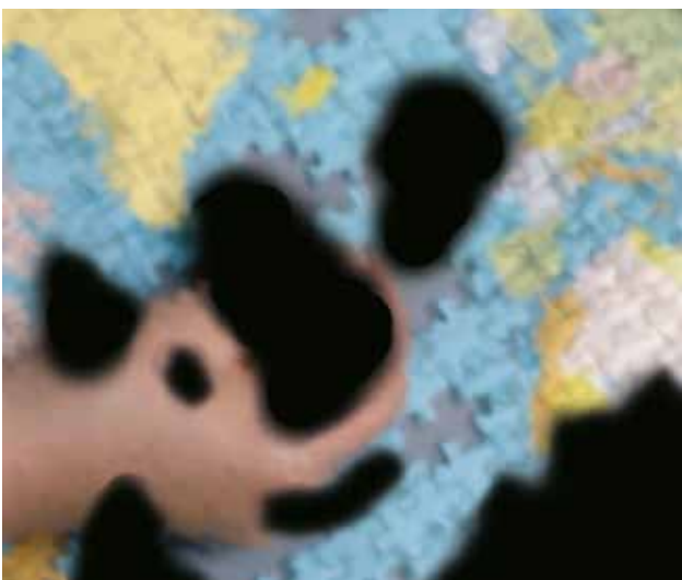
Seheindruck bei diabetischer Netzhauterkrankung